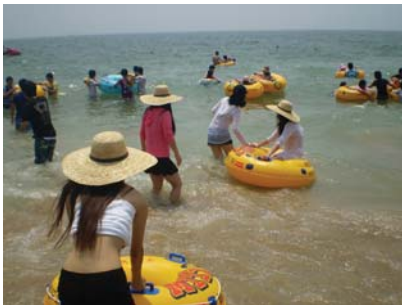
Com as crianças, os cuidados devem ser redobrados.

É o segundo tipo mais comum de câncer da pele, pode se disseminar por meio de gânglios e provocar metástase. Entre suas causas, estão à exposição prolongada ao sol, principalmente sem a proteção adequada, tabagismo, exposição a substâncias químicas com arsênio e alcatrão e alterações na imunidade.