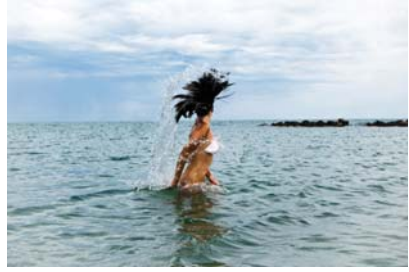
O Brasil é rico de praias bonitas. É o lazer preferido de muitas pessoas.

É necessário reaplicar o filtro solar a cada 2h ou de acordo com as instruções na embalagem.