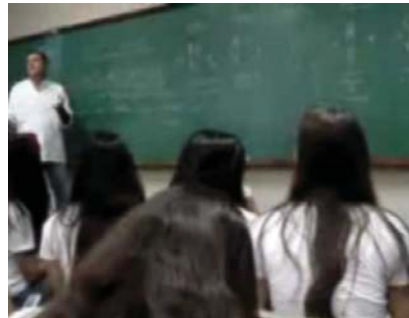
Educação formal e profissional: os grandes desafios para manter o Brasil na rota do desenvolvimento.