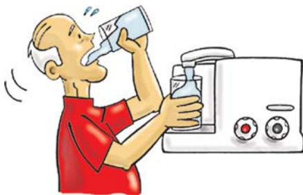
Beber muita água é fundamental para manter a saúde vocal.

A voz pode ser prejudicada por diversos motivos, dentre eles: falar demais quando se está doente, gripado ou resfriado e quando se está muito estressado e com sono; gritar e falar em forte intensidade, que geram muita sobrecarga para a Laringe; fumar e ingerir bebidas alcoólicas são o maior risco vocal; pigarrear e tossir com frequência machucam as pregas vocais; conversar em ambientes ruidosos, com cheiros muito fortes, poeira e mofo; ingerir cafeína em excesso e alimentos que causem azia e má digestão; consumir pastilhas e sprays pode mascarar sensações de esforço ao falar, mas são apenas paliativos como o mel,