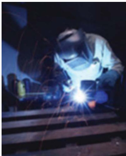
Emprego: em alta em todos os setores da economia.

tanto das empresas, como dos governos, principalmente os estaduais, em educação profissional. “A educação profissional deveria fazer parte da política educacional do estado de São Paulo, com integração entre o mundo do trabalho e a escola, para que esse contingente possa ser absorvido pelas empresas, mas mas infelizmente não é essa a nossa realidade. O pior é que já estamos pagando um preço muito caro por causa dessa falta de investimento, com empresas usando do recurso das horas extras ou importando trabalhadores para atenderem à demanda. Isso é muito ruim porque essa política tem que ser permanente e devidamente alinhada com o processo de crescimento do país, na forma de um programa permanente de qualificação profissional. Para isso acontecer, creio que será