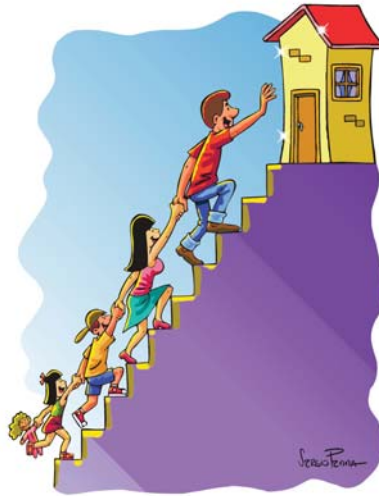
O sonho da casa própria já é realidade para milhares de famílias.

O salário mínimo, que durante anos ficou estagnado, deu um salto impressionante. “Em nenhum outro Governo o salário mínimo aumentou tanto. Os benefícios diretos do aumento real do salário mínimo são pelo menos dois. Primeiro, como é natural, oferece uma remuneração mais digna aos trabalhadores. E também dá mais fôlego ao movimento sindical para reivindicar aumentos salariais superiores ao índice da inflação, o que normalmente é ferozmente combatido por muitas empresas que ainda vêem o trabalhador apenas como “custo operacional”. Segundo porque grande massa de aposentados e pensionistas recebe apenas um salário mínimo como benefício. Ora nos dois casos, mais uma vez, o Governo pensa mais nos menos favorecidos. E não apenas por