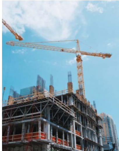
O país é um verdadeiro canteiro de obras: empregos à vista.

mão de obra”, afirmam os diretores. O aumento da massa salarial acompanha o aumento do emprego, o que é muito bom. “O trabalhador voltou a ter o direito de escolher o emprego, não precisa mais aceitar as condições precárias a que éramos